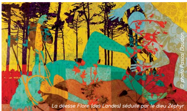
La déesse Flore (des Landes) séduite par le dieu Zéphyr